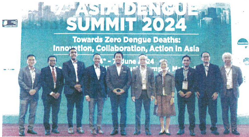
LUKANISMAN (tengah) hadir merasmikan Majlis Pelancaran Sidang Kemuncak Denggi Asia Ke-7 di Kuala Lumpur semalam.

"Di samping itu, kami juga komited untuk memperhalusi dua elemen sokongan iaitu memperkukuh faktor pemangkin untuk meningkatkan sistem kesihatan dan mengukuhkan penyelidikan