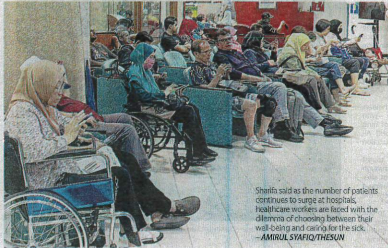
Sharifa said as the number of patients continues to surge at hospitals, healthcare workers are faced with the dilemma of choosing between their well-being and caring for the sick.

Those with comorbidities, especially chronic diseases, with low immunity and pregnant women are urged to wear masks in crowded places with poor ventilation to prevent infection.