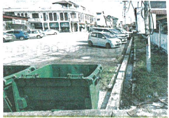
TONG sampah bersebelahan pagar KKIA di Jalan Panggung Wayang, Taiping yang menyebabkan bau busuk semalam.

"Suami atau waris yang menunggu di luar pun tak tahan bau dan masuk ke dalam klinik. Di-harapkan pihak berkuasa tempatan cari jalan penyelesaian bagi masalah ini kerana sudah banyak kali buat aduan," ujarnya.