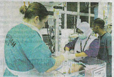
Bayi berusia tiga minggu menjadi pesakit termuda menjalani pembedahan melalui Program Kebajikan Kardiorasik Hospital USM-HLH 2024.