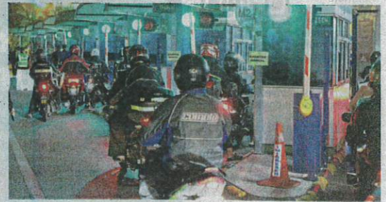
Taking precautions: Travellers crossing the Johor and Singapore border through the Second Link.

"For now, I have yet to make any drastic lifestyle changes, but I keep myself updated on the situation. If either government were to make any official announcement, I will heed them," he said.